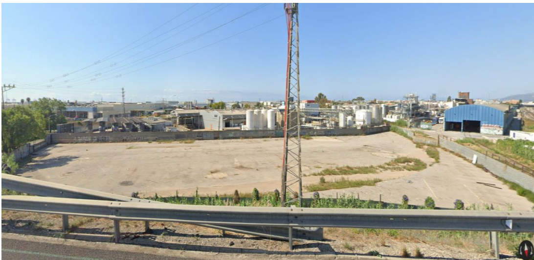
Foto del Espacio a licitar

Previo a la firma del contrato se establecerá Acta de Entrega de los espacios e instalaciones objeto de licitación, haciendo referencia explícita al estado de los suelos, y su posible contaminación. A la finalización del contrato se establecerá el correspondiente Acta de Devolución de los espacios e instalaciones, en el mismo sentido.