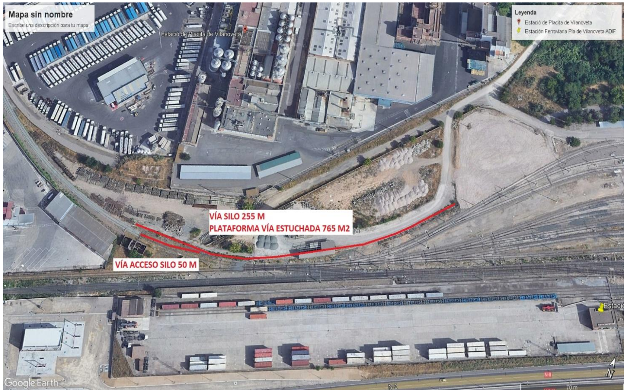
IMAGEN 4: VISTA DEL ACCESO E INSTALACIONES FERROVIARIAS FUTURAS