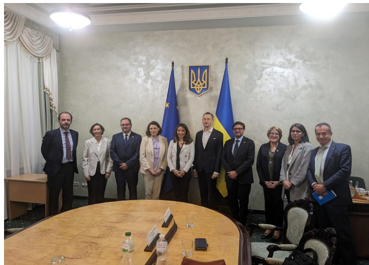
Detalle de una de las reuniones bilaterales en Kiev

En lo referido a los asuntos relacionados con la subdirección de Innovación Estratégica, fue presentado con detalle el proyecto de cambio de ancho automático para mercancías (Mercave) y con el principal resultado es la firma de un acuerdo para desarrollar lo antes posible un proyecto piloto para las pruebas de este sistema español en Ucrania. La documentación referida a los intercambios fue remitida a nuestra dirección general y desde esta a la presidencia de Adif DG a la presidencia de Adif.