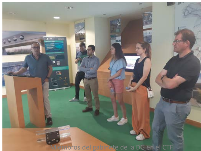
Miembros del gabinete de la DG en el CTF