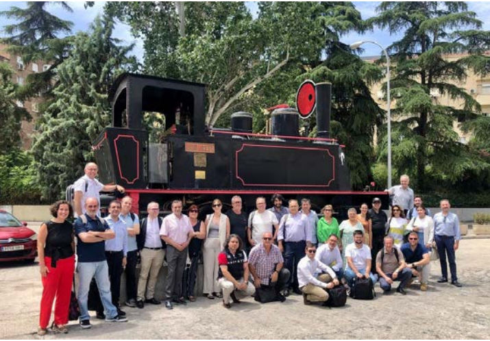
Personal de la subdirección de Innovación Estratégica