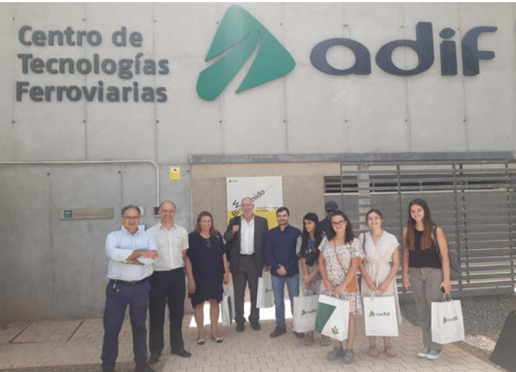
Miembros de la Real Academia de Ingeniería en su visita al CTF

La Real Academia de Ingeniería es una institución que promueve la excelencia, la calidad y la competencia de la Ingeniería española en sus diversas disciplinas y campos de actuación